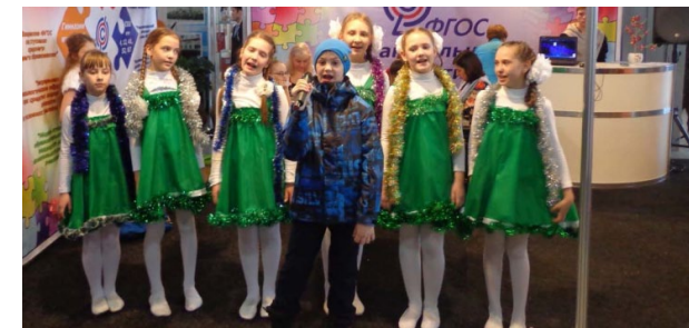
Презентация экологического проекта